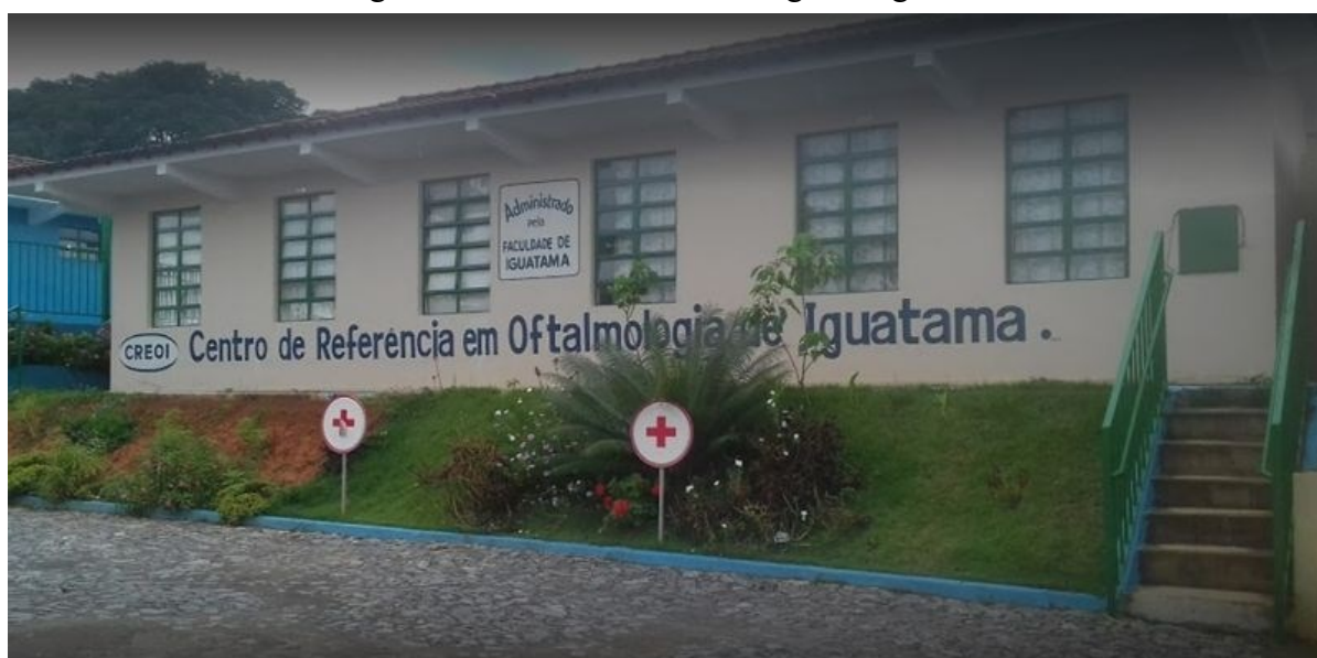
Figura 6 – Centro de Oftalmologia de Iguatama

Embora a goëthita e a hematita possam ser estritamente sedimentares no solo, soluções hidrotermais de baixa temperatura podem cristalizá-las (FIG. 6).