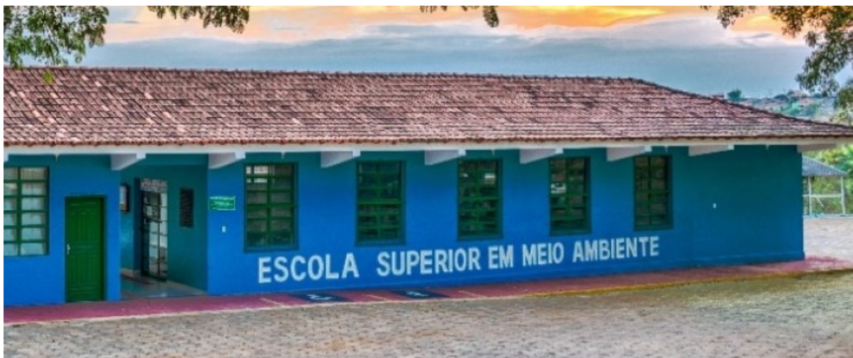
Figura 7 – Foto da entrada da faculdade